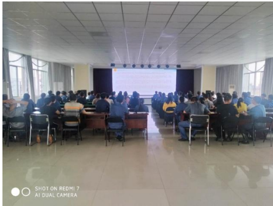
图表 2-9 员工岗前培训