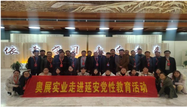
图表 2-5 员工户外及文体活动