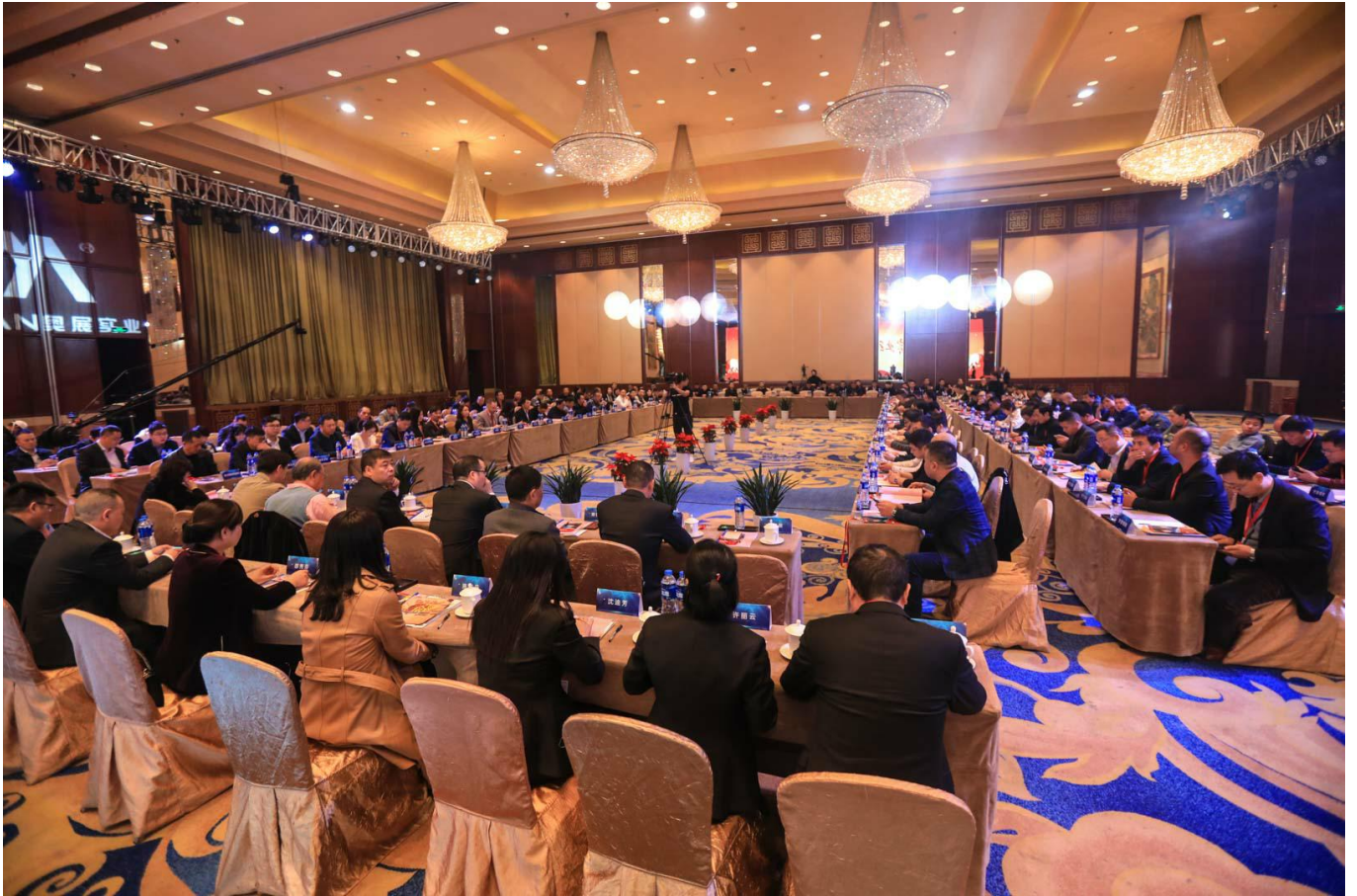
图表 2-6 供应商年会