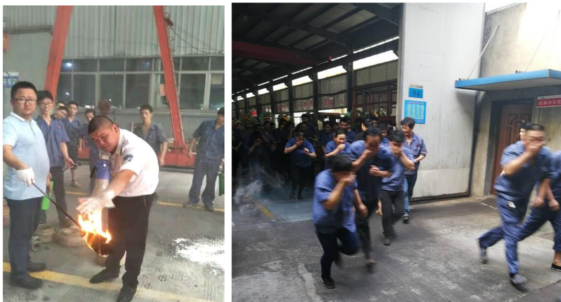
图表 2-3 消防安全演练及培训

公司严格遵守并执行《中华人民共和国劳动法》、《中华人民共和国安全生产法》、《中华人民共和国职业病防治法》等法律法规，建立和完善公司的环境管理体系，积极为员工创建安全、舒适的工作环境。公司按照“管生产必须管健康”的原则专门制定并严格执行《职工劳动保护管理规定》，对特殊工种和作业中存在职业危害因素的如具有粉尘、噪声、有毒有害气体等危害岗位作业的员工，提供符合国家标准和卫生要求的配套齐全的劳动防护用品，监督劳动保护，并定期组织开展职业健康体检。