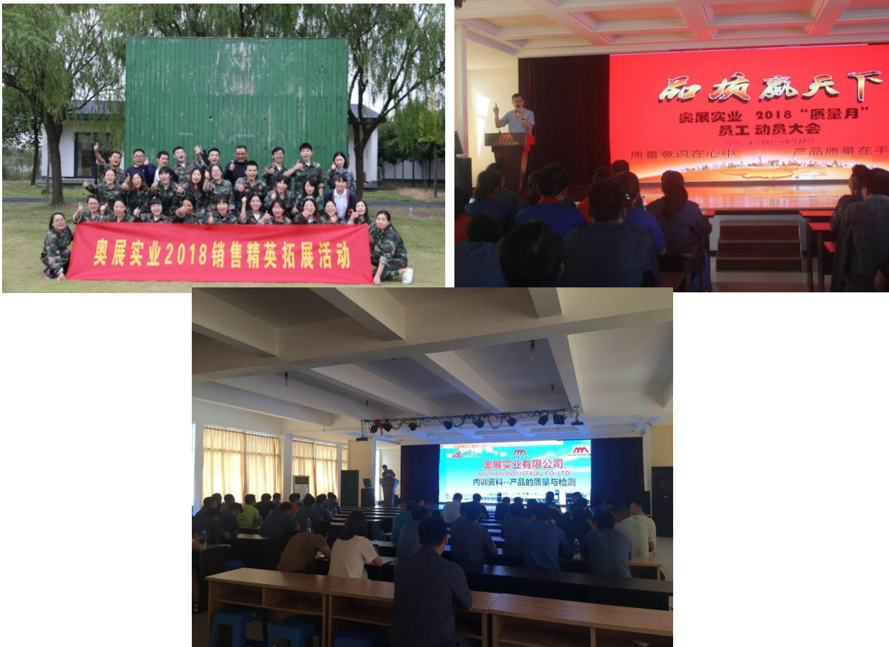
图表 2-2 各岗位拓展培训